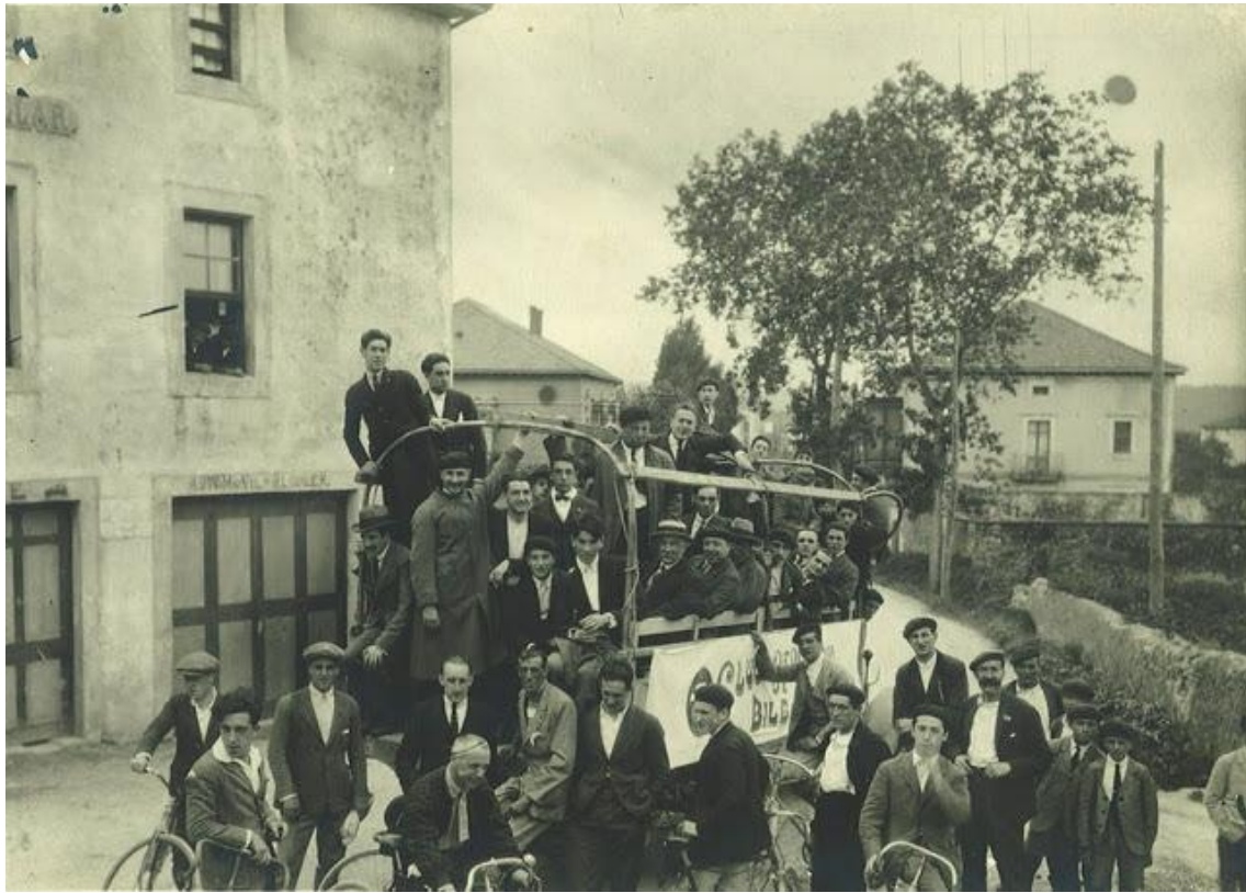
se prepara la carrera ciclista

En el año 1932 Sir Archibald periodista del Excelsius recibe una carta de Juan Moser. Sir Archibald es Alejandro de la Sota el compañero de juego de Moser en el Athletic.